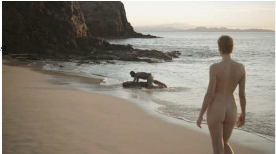
The Invader & The Origin of the World

De wereld telt meer op drift geraakte oorlogsslachtoffers en economische vluchtelingen dan ooit. De migrant kan dan ook met recht 'de hoofdpersoon van de 21ste eeuw' genoemd worden. Het mediabeeld van migranten is echter vaak ééndimensionaal. Het Rotterdamse kunstpodium A Tale of a Tub organiseert deze en volgende week filmavonden in EYE waarin gezocht wordt naar alternatieven.